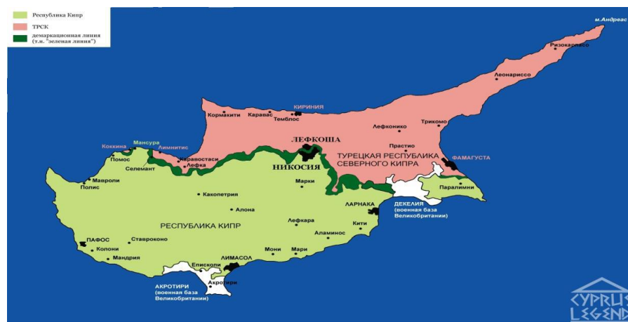
Сурет 2 - Кипр аралының әкімшілік бөлінісі

Солтүстік Кипр Түрік Республикасы (СКТР)* Түркітілдес елдер ішінде Түркия Республикасы мен СКТР-дан* кейін, Кеңестер Одағының ыдырауына байланысты бұрын оның құрамында болған – Қазақстан, Өзбекстан, Әзірбайжан, Қырғызстан және Түрікменстан республикалары өз тәуелсіздігіне қол жеткізген соң, олар – 1992 жылдың 2-ші наурызында Біріккен Ұлттар Ұйымына мүше болып қабылданды. Осылайша Кеңестер Одағының ыдырауы, әлемнің саяси картасына жаңадан тәуелсіз 5 жас егемен мемлекетті әкелді. Олар – Еуразия материгінің орталық бөлігінде орналасқан, төмендегі 1-ші кестедегі аталмыш түркітілдес мемлекеттер.